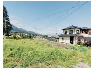
飯田市立旭ヶ丘中学校まで2900m 飯田市立伊賀良小学校まで1087m