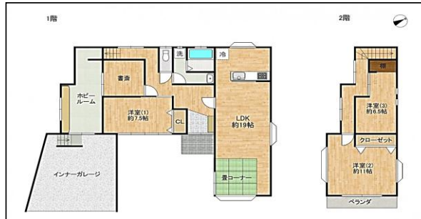
間取り図1799万円、3SLDK、土地面積317.41㎡、建物面積169.64㎡