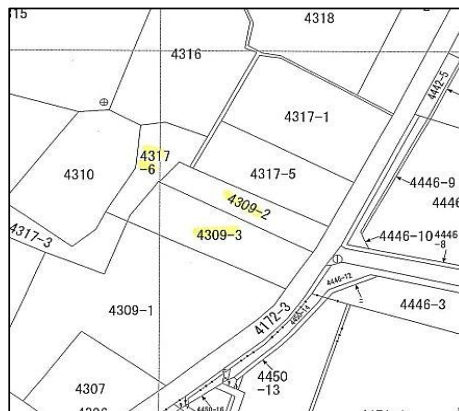
区画図 土地価格533万円、土地面積329.08㎡